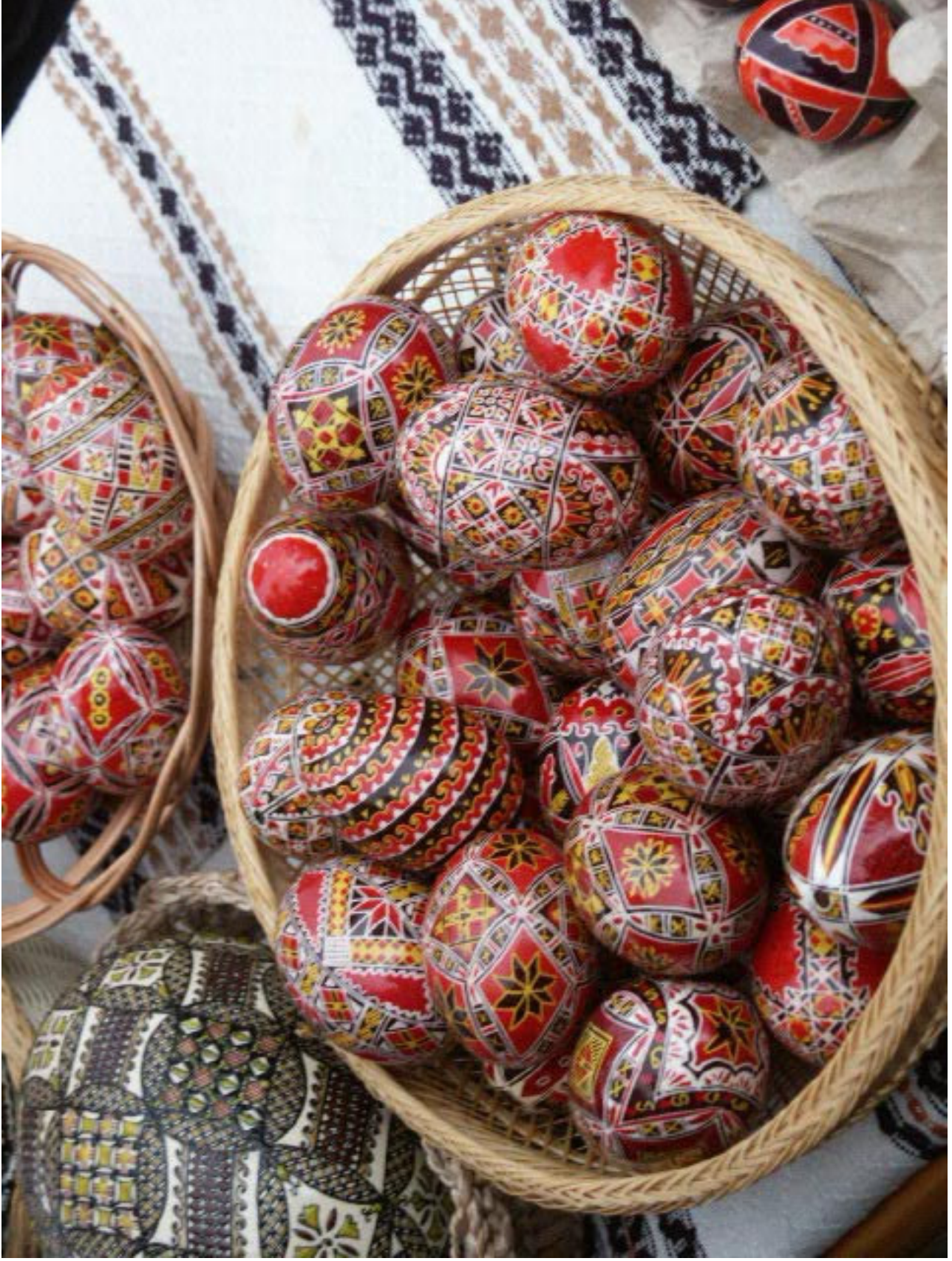
Ouă de Paște din Bucovina